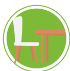
TEXTILES DE MAISON