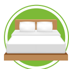
ARTICLES DE LITERIE