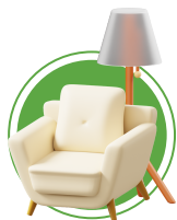
TEXTILES DE MAISON