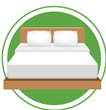
ARTICLES DE LITERIE