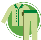
PYJAMAS ET VÊTEMENTS D'INTÉRIEUR